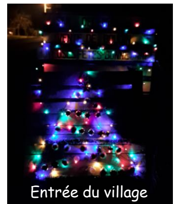
Entrée du village