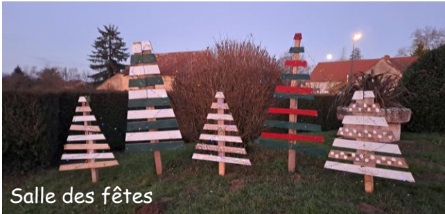
Salle des fêtes