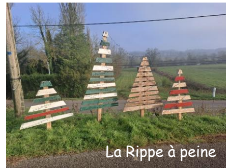
La Rippe à peine