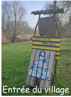
Entrée du village