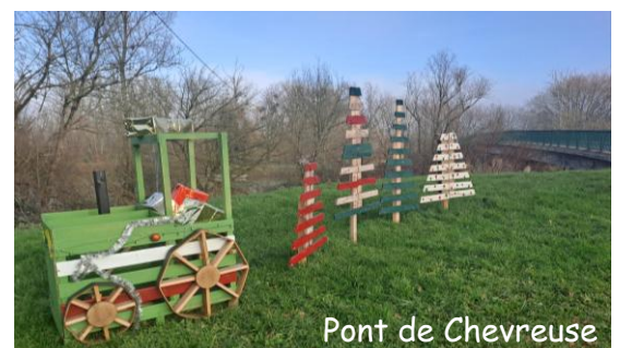
Pont de Chevreuse