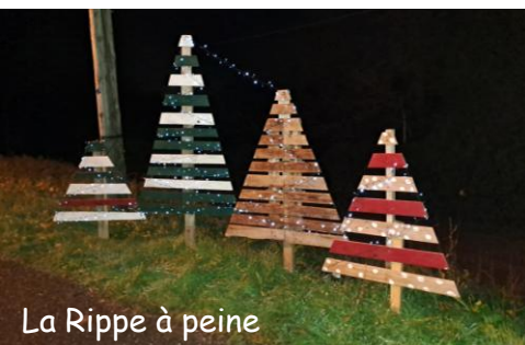
La Rippe à peine