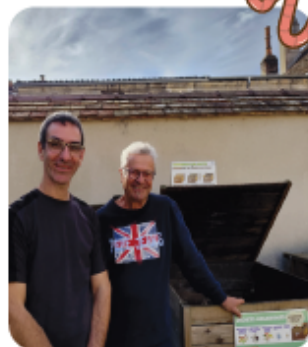
La placette a déjà 10 ans !