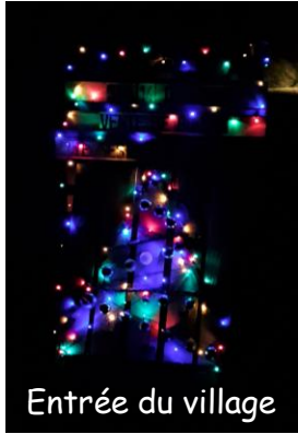
Entrée du village