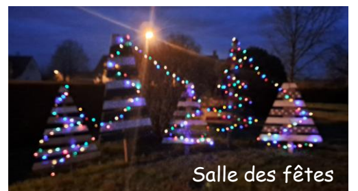
Salle des fêtes