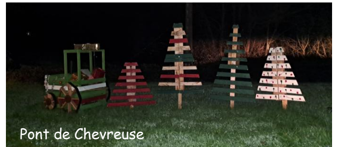
Pont de Chevreuse